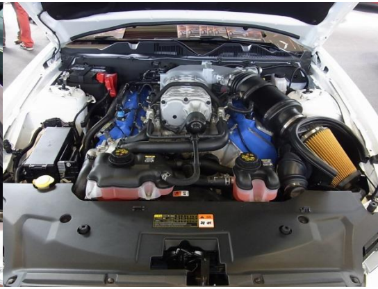
Ein neuer V8....naja, wem es gefällt...

Die anderen 8 Hallen waren wieder vollgepackt mit allerlei Kurioseem und Sehenswertem, das ich euch nicht vorhalten will.