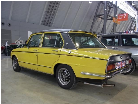
Ein gelber Dolli