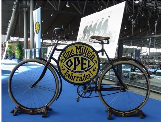
Tja, Opel, das waren noch Zeiten, als deine Produkte millionenfach über den Tresen gingen, was?