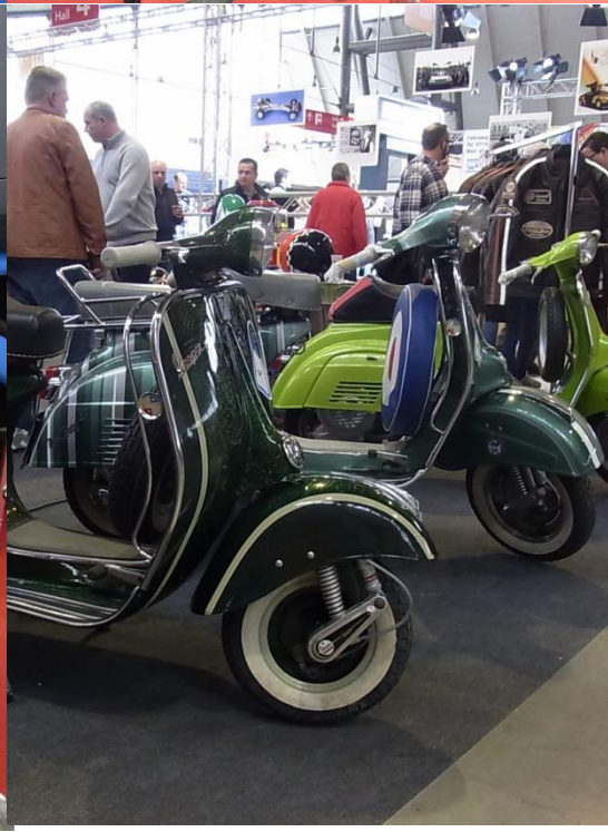
... und noch mehr