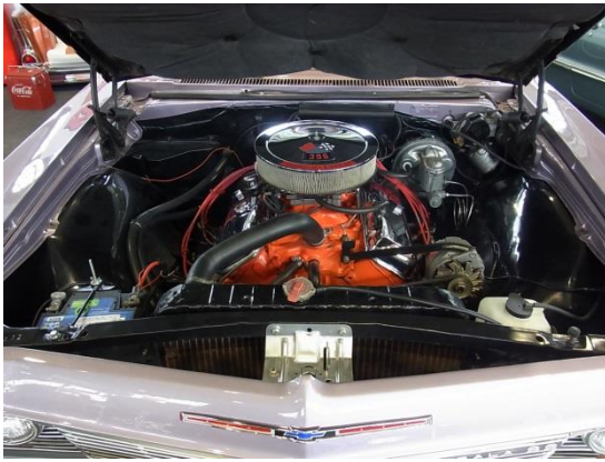
Ein alter V8, herrlich.....