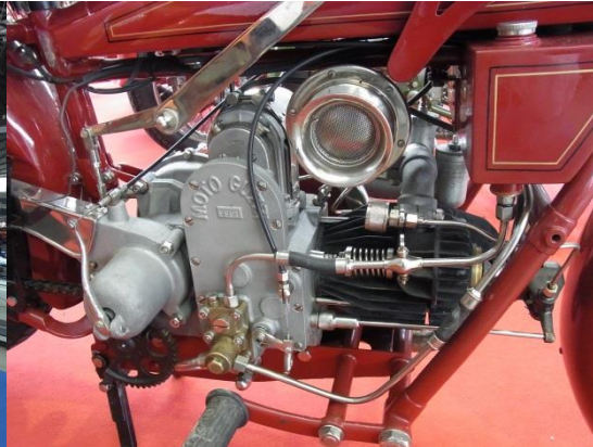
Moto Guzzi darf natürlich nicht fehlen, damals noch ohne Stationär V-Motor