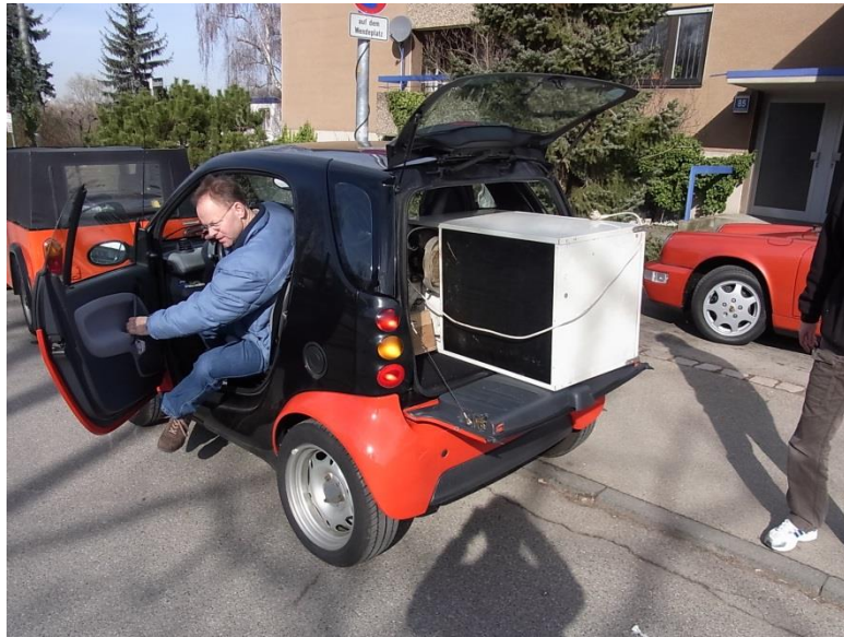
Brüchis Kühltransporter, 2 Personen und für 1 Kühl-schrank-tauglich!!!!