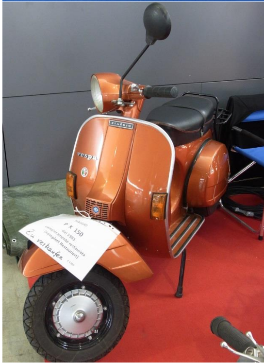
„Wald- und Wiesen-vespa“