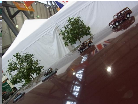
Ein Morris Minor in Original- größe und 4 kleineren Maßstäben