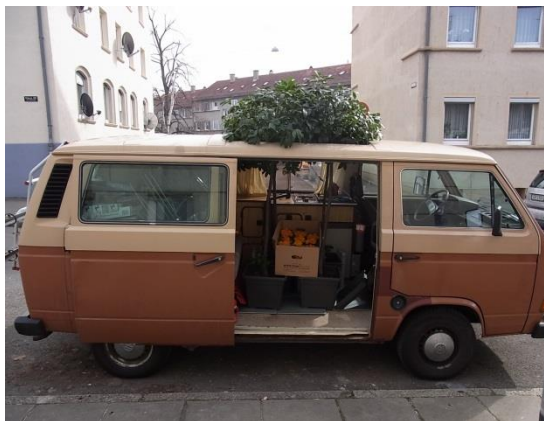
„Baumtransporter, Bäume windfest bis 85km/h.“