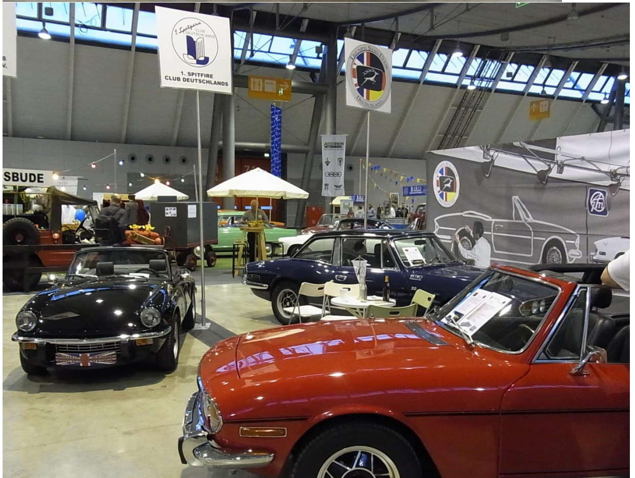
Auch die Tierwelt kam bei uns nicht zu kurz, Hirsche friedlich neben Drachen.