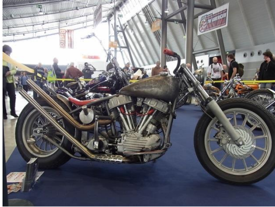
Bike mit Drehgriffbremse

Verrückt, was eine Wald- und Wiesen-Vespa heutzutage kostet. Für das Geld kaufen andere richtige Motorräder...hätt ich vor 15 Jahren doch nur zugeschlagen, ich wär heut reich!