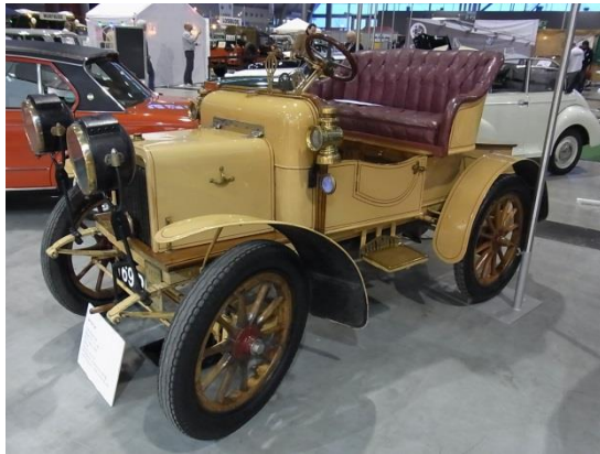
Ein Rover hp6