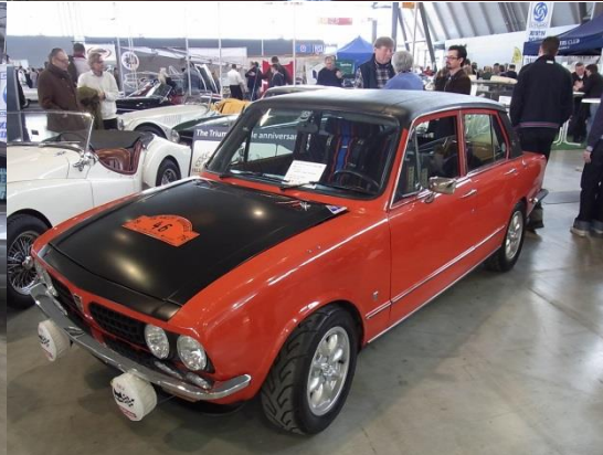
Ein roter Dolli