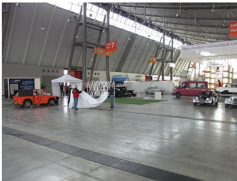
So sieht die Messehalle Mittwoch mittags um 13.00 Uhr aus.

Nachdem alles verladen war, ab auf die Messe, ausladen, aufbauen und freuen. Meistens dauert es nicht lange bis die Helfer eintrudeln, einige mit ihren Ausstellungsfahrzeugen, andere nur zum Helfen. Teppiche ausrollen, Zelte aufbauen, Küche aufbauen, Schilder aufhängen, Tischdecken auslegen, Bier kaltstellen...geschafft! Und im Handumdrehen hat sich eine kalte, zugige Halle in einen gemütlichen Ort verwandelt an dem es nach Kaffee, Benzin und Hopfen riecht ... herrlich.